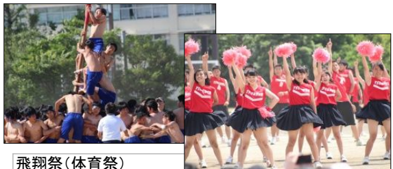
飛翔祭(体育祭) 広大なグラウンドのおかげで盛り上がりがあります。応援団の衣装やダンス、各団の団旗といった芸術面も見事です。