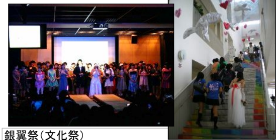
銀翼祭(文化祭) 各クラスが演劇・映像・ダンスなどで競うほか、部活動・教科・有志等、計50以上の出し物でにぎわいます。

広くてきれいな校舎内にはラウンジ・自習スペースなどがあり、各種専門教科の教室や設備も、質・量ともに充実。そして400mトラックに2つの体育館…これらの設備に支えられて、授業はもちろん、部活動や行事も華やかになっています。