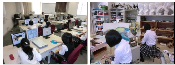
左＝情報科：コンピュータグラフィックスの授業 右＝美術：絵画の授業 (これらの教科や工業、理科、語学などで、実習施設が用途別に複数あります)

多くの選択科目がありますが、右記の5つの「系列」が本校の「得意分野」です。専門的な科目、さまざまな目的に特化した科目を多数設置。受験への対応はもちろん、進みたい分野の専門的な知識を身に付けたり、役立つ資格を取得したりできます。